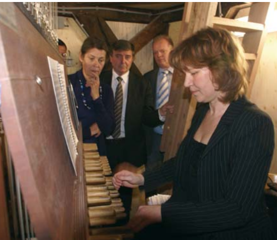
De beiaardier ontvangt haar eerste gasten.