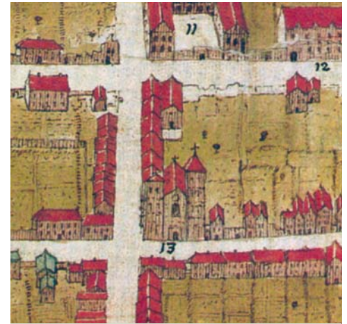
Op de kaart van Janssens staat de H. Geestkerk (nr. 13) nog fier overeind. GAR

Op 3 en 11 juni 1664, drie jaar na de verheffing van de St.-Christoffel tot kathedraal, pakt men het grootser aan. Volgens het vergaderverslag spreekt men dan 'aengaende de 800 Rycksdaelers noodich tot de loon ende materialen van de eerste octave van de clocken van den Beyart te maeken in den toren van de Cathedrale Kerc-