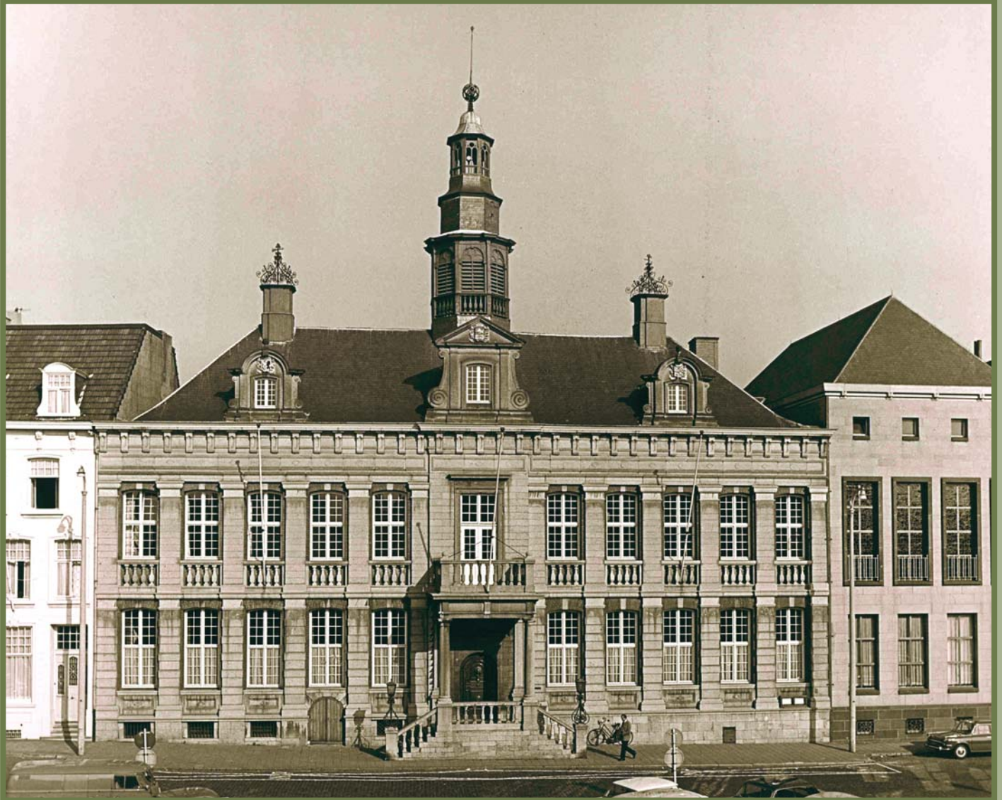
De stadhuistoren deed rond 1970 nogal somber aan.